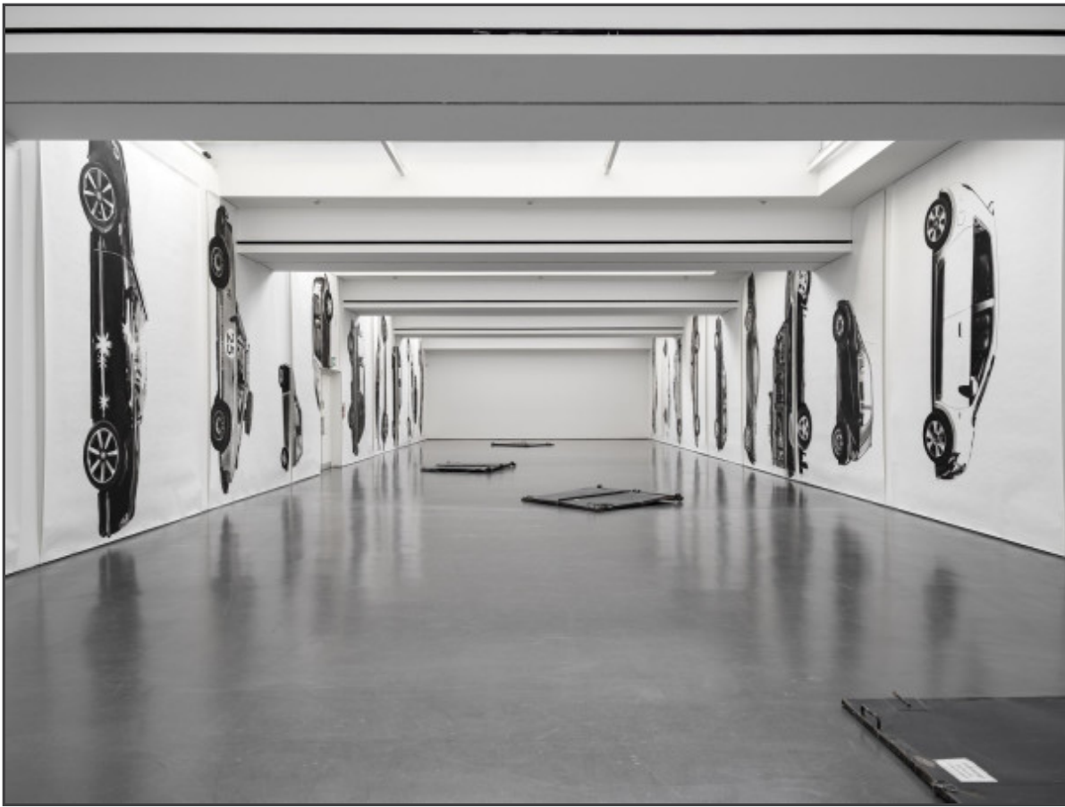
Angharad Williams, Cars (2022), Installationsansicht Eraser , Kunstverein für die Rheinlande und Westfalen, Düsseldorf, 2022, Foto: Cedric Mussano

Lassen sich diese entwurzelten, vom Himmel gefallenen Autos zunächst als symbolisches Zentrum kleinbürgerlicher Aufstiegsideologie, als Metaphern für Vereinzelung und Klassentrennung im Kapitalismus lesen, öffnen sich bei genauerem Hinsehen auch Momente des Konkreten. An der äusseren Karosserie und durch die Autofenster erscheinen die diversen Lebensrealitäten Berliner Autobesitzer:innen; es sind keine kahlen, generischen Share-Now-Leihwagen, sondern mit Plüschtieren, Sonnenschutzblenden, Stickern und getunten Bremsen individualisierte, gepimpte Gefährten von Kleinfamilien und stolzen Sportwagenbesitzer:innen. Doch die Fahrer:innen und Beifahrer:innen bleiben hier abwesend. In einigen Autofenstern spiegeln sich andere Autos oder Szenen des urbanen Lebens in Berlin, Menschen aber sind nie zu sehen. Von seinem Herrchen verlassen, wird das Auto in Williams' Kohlezeichnungen zum eigenständigen Akteur erhoben. Ähnlich wie Schklowski das Auto zum menschenähnlichen Wesen stilisiert, wird das Auto bei Williams zu einem beseelten, verselbstständigten Ding.