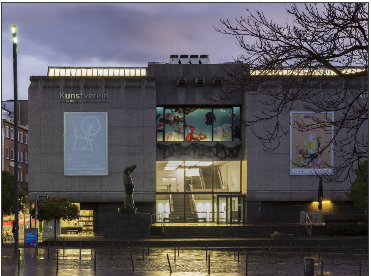
Angharad Williams, Self reliance is a fetish (2022), Installationsansicht Eraser , Kunstverein für die Rheinlande und Westfalen, Düsseldorf, 2022, Foto: Cedric Mussano

Die Explosionsszene lässt auch an die Inbrandsetzung des Brüsseler Kaufhauses À l'innovation denken, bei der neben Waren auch über 200 Menschen draufgingen und die der RAF und der Kommune 1 als Vorbild für ihre Kaufhaus-Brandstiftungen diente. Im Flugblatt Nr. 8 ( Wann brennen die Berliner Kaufhäuser? ) verkündete die Kommune 1 1967: «Unsere belgischen Freunde haben endlich den Dreh raus, die Bevölkerung am lustigen Treiben in Vietnam wirklich zu beteiligen: sie zünden ein Kaufhaus an, zweihundert saturierte Bürger beenden ihr aufregendes Leben und Brüssel wird Hanoi. [...] Burn, warehouse, burn!» [13] Ihre Angriffe auf Waren wollten sie somit auch als Angriff auf die bürgerliche Ignoranz gegenüber dem Vietnam-Krieg und anderen politischen Missständen verstanden wissen. Vor diesem Hintergrund erscheint das an der Aussenfassade angebrachte und damit an die Öffentlichkeit gerichtete Bild explodierender Waren wie ein Spiegel, der der bürgerlichen Stadtgemeinschaft Düsseldorfs warnend entgegenschlägt.